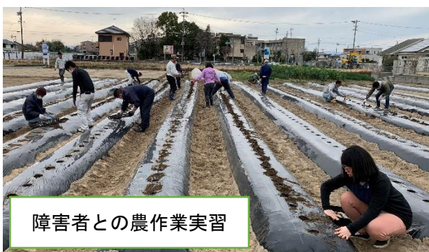
障害者との農作業実習