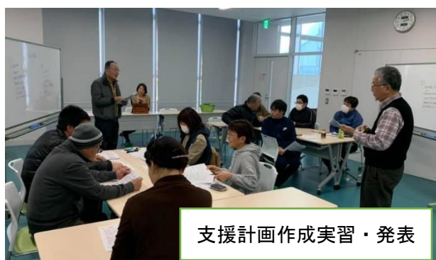
支援計画作成実習・発表